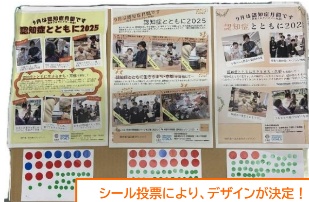
シール投票により、デザインが決定！！