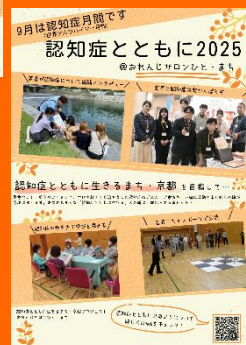
◎おれんじサロン ↑ ひと・まち