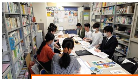
社会福祉を学ぶ学生さんからも ご意見を伺いました！