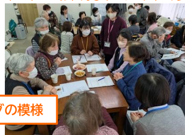
認知症カフェでのミーティングの様様