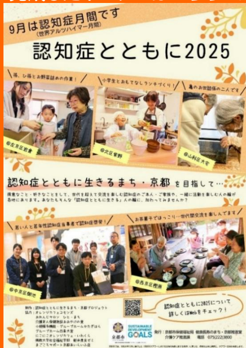
◎京都市認知症疾患 ↓ 医療センター 北山病院

また、ポスターデザインのテンプレートを共有したところ、 様々なバージョンのポスターができました。