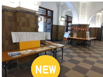
市役所本庁舎正面玄関

今年度新たに加わった、 市立病院図書館・市役所では それぞれ9月1日～30日の間 啓発展示を実施しました。