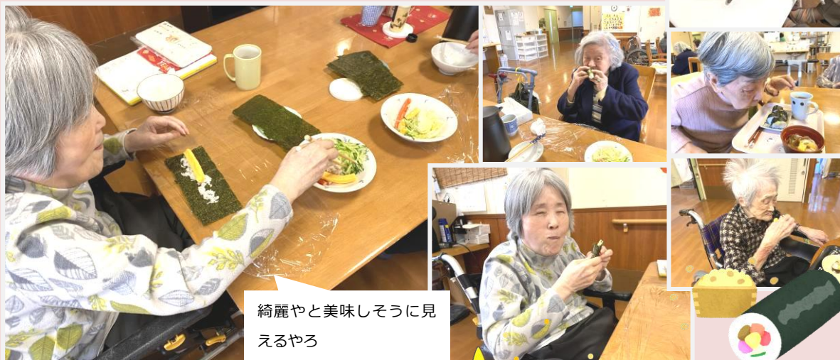
綺麗やと美味しそうに見えるやろ

今日は節分らしく巻きずしとミニうどんのセット。出汁巻き、カニカマ、椎茸など沢山の中から具材を選んでオリジナル巻きの完成です♪