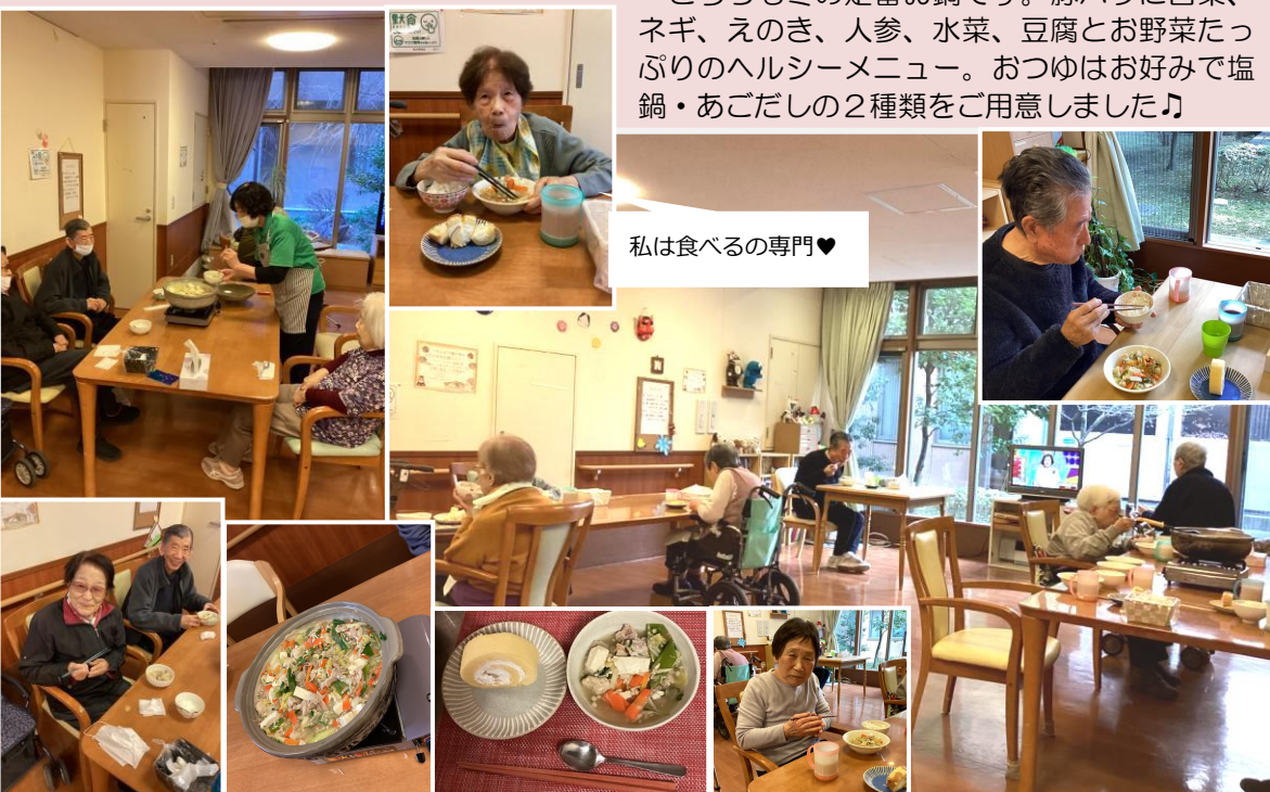
私は食べるの専門♡

こちら冬定番のお鍋です。豚バラに白菜、ネギ、えのき、人参、水菜、豆腐とお野菜たっぷりのヘルシーメニュー。おつゆはお好みで塩鍋・あごだしの2種類をご用意しました♪