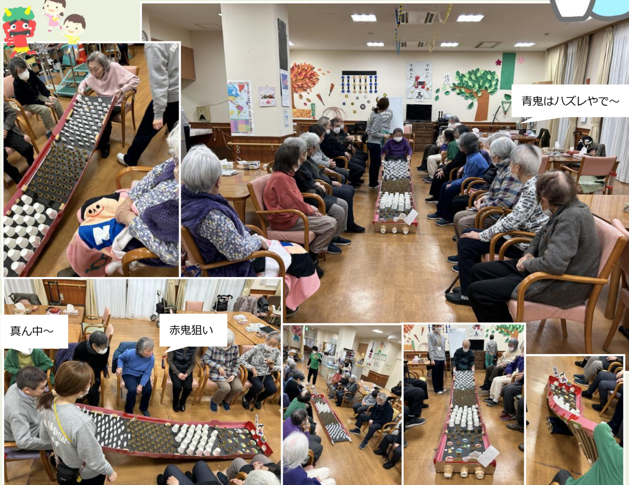
青鬼はハズレやで～