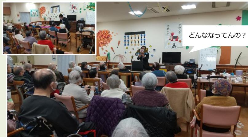
どんななってるの？

箱の中からハトが飛び出て大歓声！よく見るとおもちゃのハトですが生きてる様でした♪