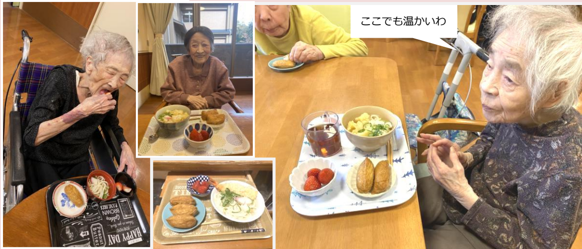
ここでも温かいわ