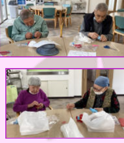
干支の馬作り第2弾