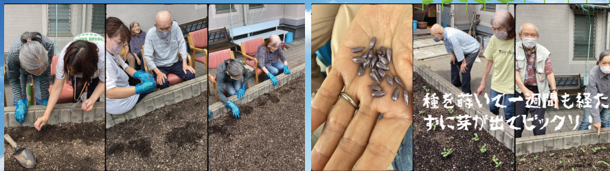
種を蒔いて一週間も経たずに芽が出てビックリ!

去年「誰かの力にられるなら」と、みなさんとともに熱心に取り組んでくださいました。今年も沢山ひまわりを咲かせましょう!!