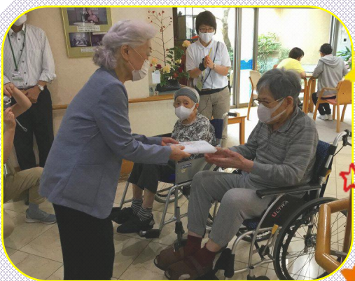
皆様の健康と長寿を願っております！